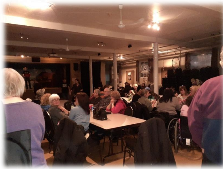
Soirée dansante du Carnaval des neiges