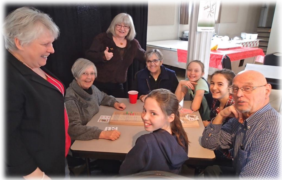
Activité intergénérationnelle 2017