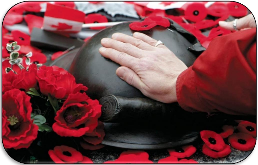
Jour du Souvenir