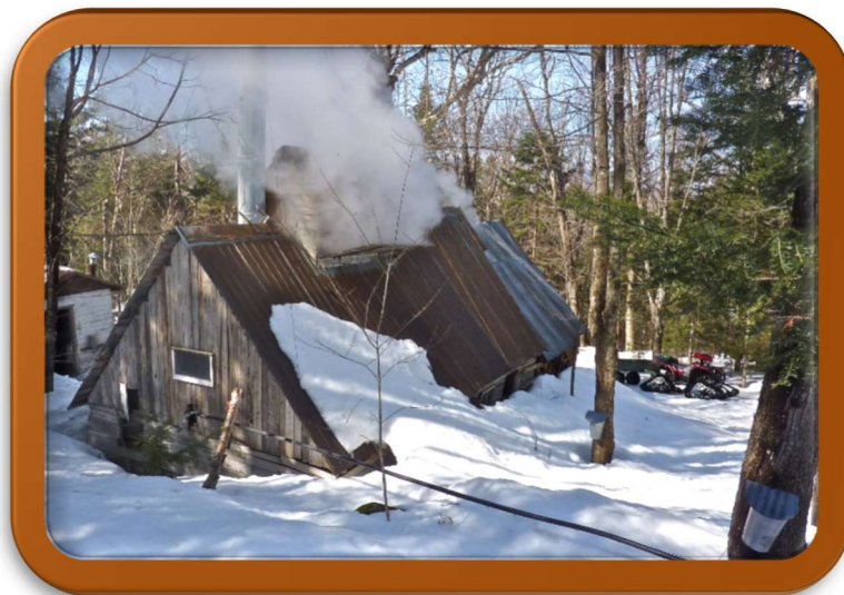
Cabane à sucre dans le rang de la Colonie et construite en 1950